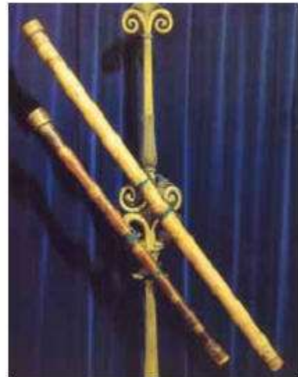
De eerste telescopen waarmee hij zijn waarnemingen deed