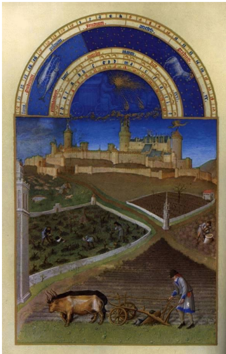
Kalenderblad maart: boeren hard aan het werk

Meer dan 90 % van de mensen werkte op een domein als boer, arbeider of personeel van de heer. De koning en de leenmannen konden rijk worden, omdat de boeren voor hen werkten. Zij konden de opbrengsten verkopen of ruilen voor andere producten.