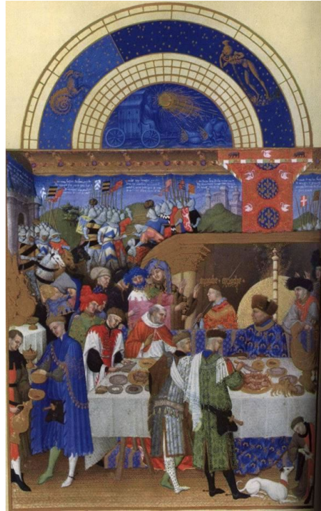
Kalenderblad januari: de adel heeft het goed

Er waren 3 soorten boeren: de vrije boeren , de horigen en de lijfeigenen .