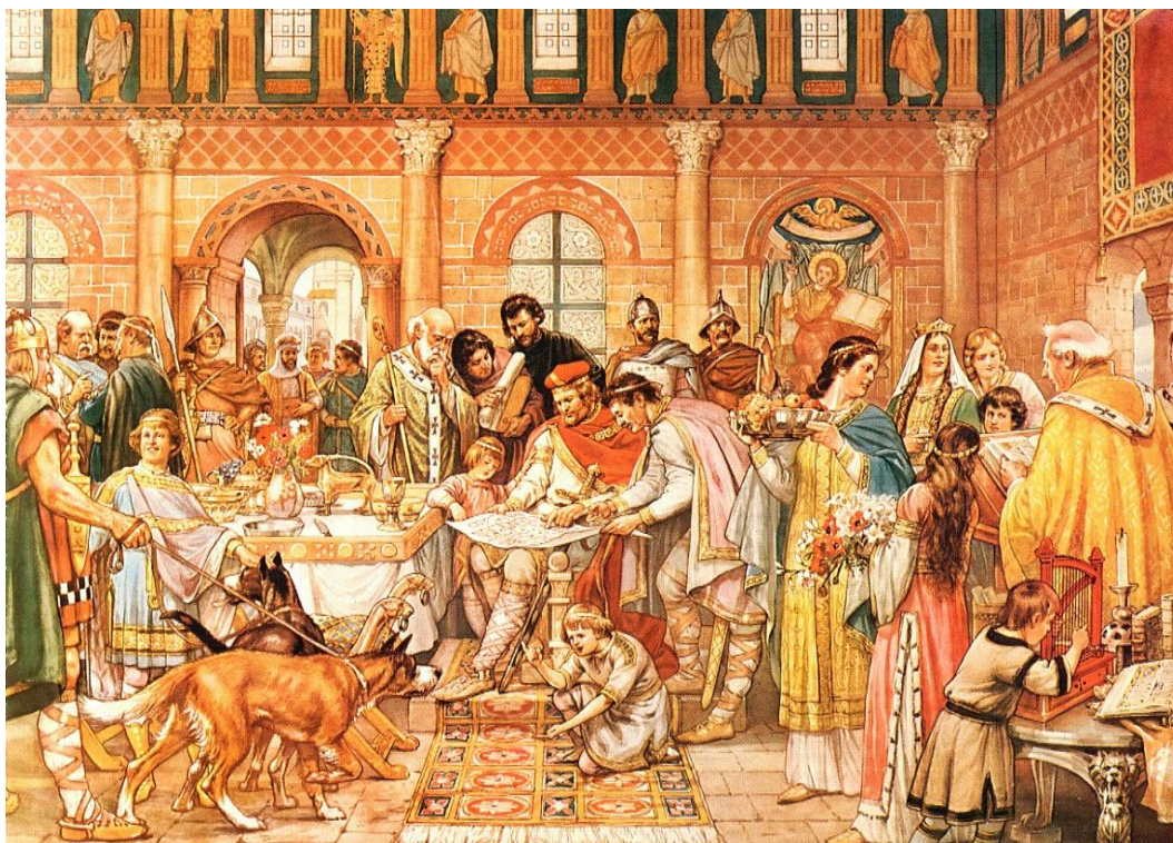
Aan het hof van Karel de Grote

De koning en zijn edelen waren niet de enigen met veel macht en rijkdom. Naast deze wereldlijke macht was er ook de macht van de kerk. Omdat de kerk het leven en het denken van de meeste mensen bepaalde, had zij erg veel invloed: het was de geestelijke macht. Het kwam vaak voor dat de koning en de paus (de leider van de kerk), elkaar tegenwerkten: zij wilden allebei de baas zijn.