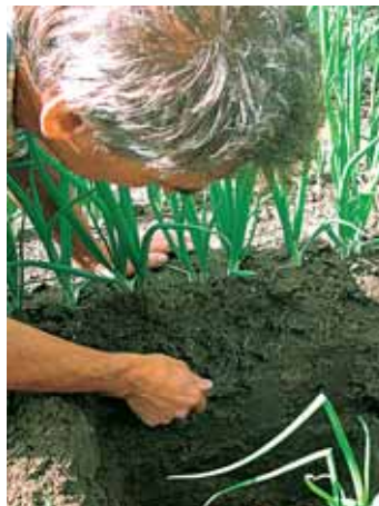
2. Beoordeel de profielwand