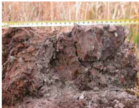
Roest duidt op water fluctuaties