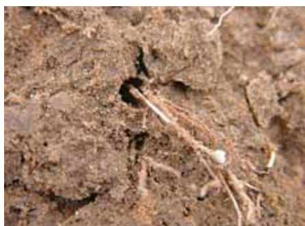
Beworteling door een wormengang

Wormen en sporen van wormenactiviteit (wormgangen, uitwerpselen) zijn vaak heel duidelijk te zien. Ook de regenwormen die worden gevonden zijn een indicatie voor de activiteit van het bodemleven. De activiteit van het bodemleven is alleen door ervaring echt goed te beoordelen aan de hand van een kuil.