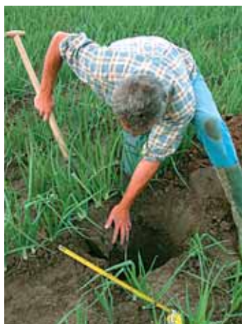
4. Haal de kluit naar boven