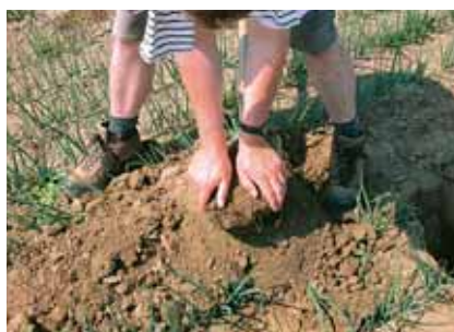
6. Breek en beoordeel de kluit