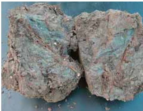
Een blauwe kleur wijst op zuurstofloze condities

Roestvlekken duiden op ijzerverbindingen en een fluctuerende grondwaterstand. Dit kan een indicator zijn tot hoe hoog het water in de (winter)perioden komt. In zandgronden waar alle ijzer uit verdwenen is, geeft een bleek grijze en vaste ondergrond aan tot welke hoogte de grond jaarlijks verzadigd is met grondwater.