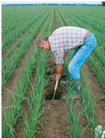
1. Graaf een kuil