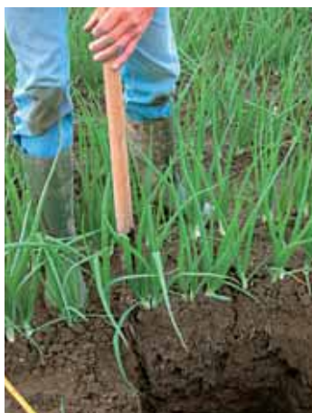
3. Steek een kluit uit