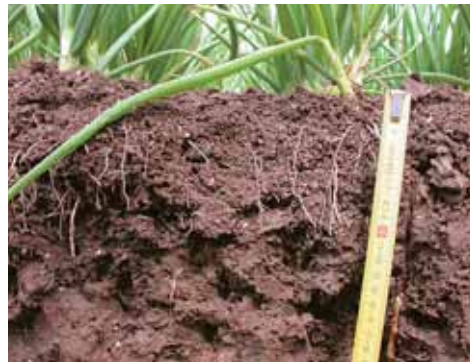
Intensieve, ongestoorde beworteling in de top

Verdikte wortels duiden op bodemweerstand