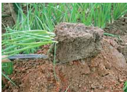
5. Leg de kluit op de grond