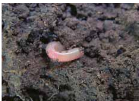
Bodem met worm en wortels

Tijdens het graven van de kuil kan men al het bodemleven wat men tegenkomt verzamelen. Zo kan een beeld verkregen worden van de soorten bodemdieren die er op een perceel voorkomen. Wel is dit alléén het bodemleven dat met het blote oog zichtbaar is. Een groot deel van het bodemleven is te klein om met het blote oog te zien. Met name de poriën en gangen geven een goede indicatie van de activiteit van het bodemleven. Wormgangen en grotere poriën alsmede de uitwerpselen van wormen geven een beeld van de activiteit die in de bodem voorhanden is. Rond resten van organische meststoffen of gewasresten kan in veel gevallen activiteit van het bodemleven waargenomen worden. Is deze activiteit rond resten nagenoeg afwezig dan duidt dit op zeer ongunstige condities waarin de afbraak en daarmee het vrijmaken van voedingsstoffen waarschijnlijk (zeer) traag verloopt.