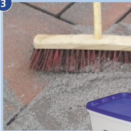
Invoegen met bezem of rubber trekker.