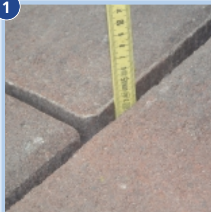
Minimaal 5 mm voegbreedte en minimaal 30 mm voegdiepte.

Geschikt voor tuinpaden, terrassen en opritten. Waterdoorlatend, vorstbestendig en milieuvriendelijk. Eenvoudig te verwerken en geschikt voor alle soorten sierbestrating. Voegbreedte minimaal 5 mm en voegdiepte minimaal 30 mm.