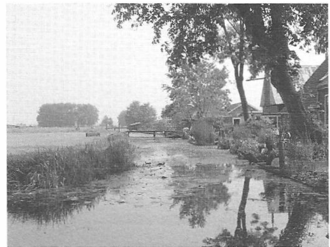
Figure 57 - 60 Images of the peat lowlands