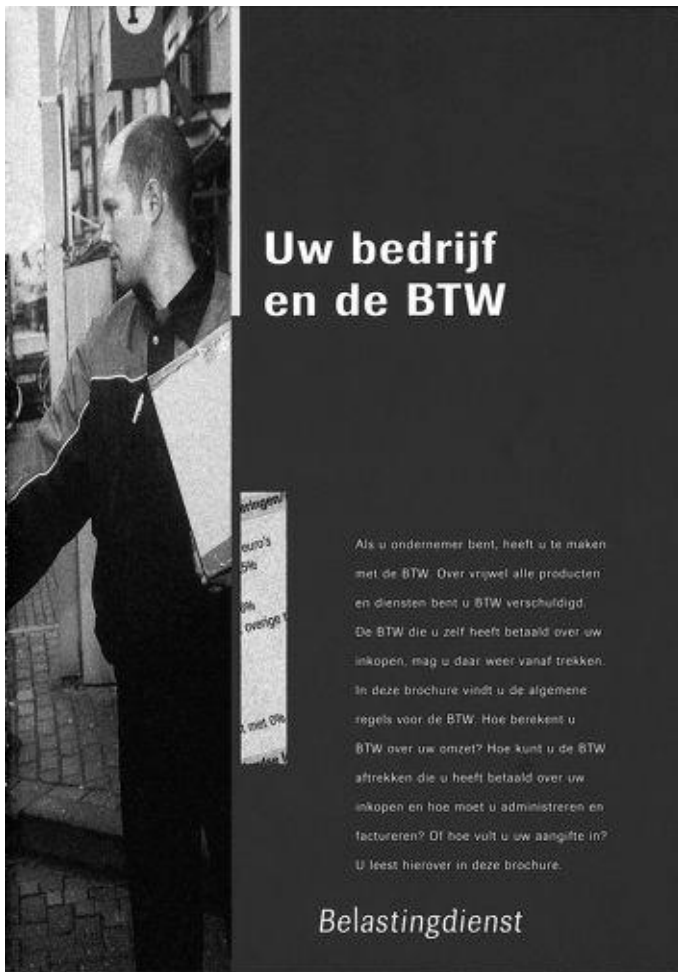
Figuur 13-16: In de voorlichtingsfolder van de Belastingdienst worden de belangrijkste regels omtrent BTW uitgelegd.