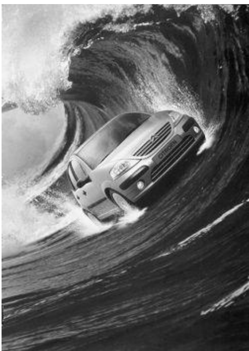
Figuur 13-18: Als je wilt verkopen, zul je reclame moeten maken!

f Welk nadeel heeft het maken van veel reclame?