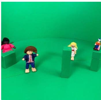
Poppen in Greenscreenbox®

Hieronder zie je een voorbeeld met de Greenscreenbox® App: