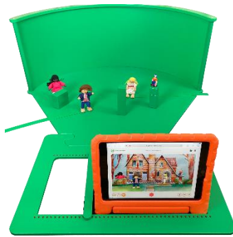
Zet de app aan