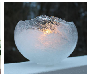
Ijslantaarn van een ballon