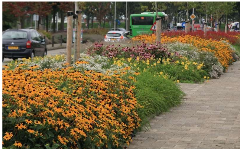
onderhoud kruidachtige beplanting