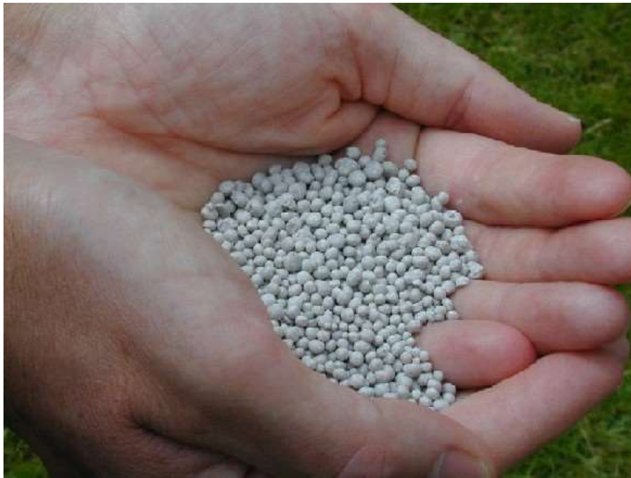
onderhoud kruidachtige beplanting