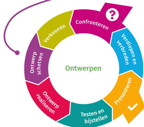
Onderzoeks- en ontwerpcyclus (SLO)