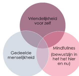
Figuur 1: De elementen voor zelfcompassie