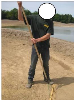
Foto: Grijp niet te hoog aan en houd enige afstand tot jezelf

Ook kunnen een toevallige steellengte of een gewoonte oorzaak zijn van het vegen met een geheven schouder.