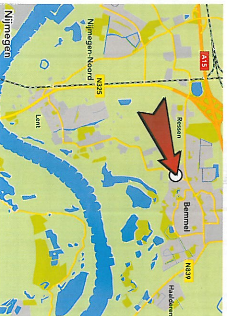
ILLUSTRATIE: NILS BIERMAN