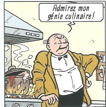
Ansichouw mijn culinaire genialiteit!