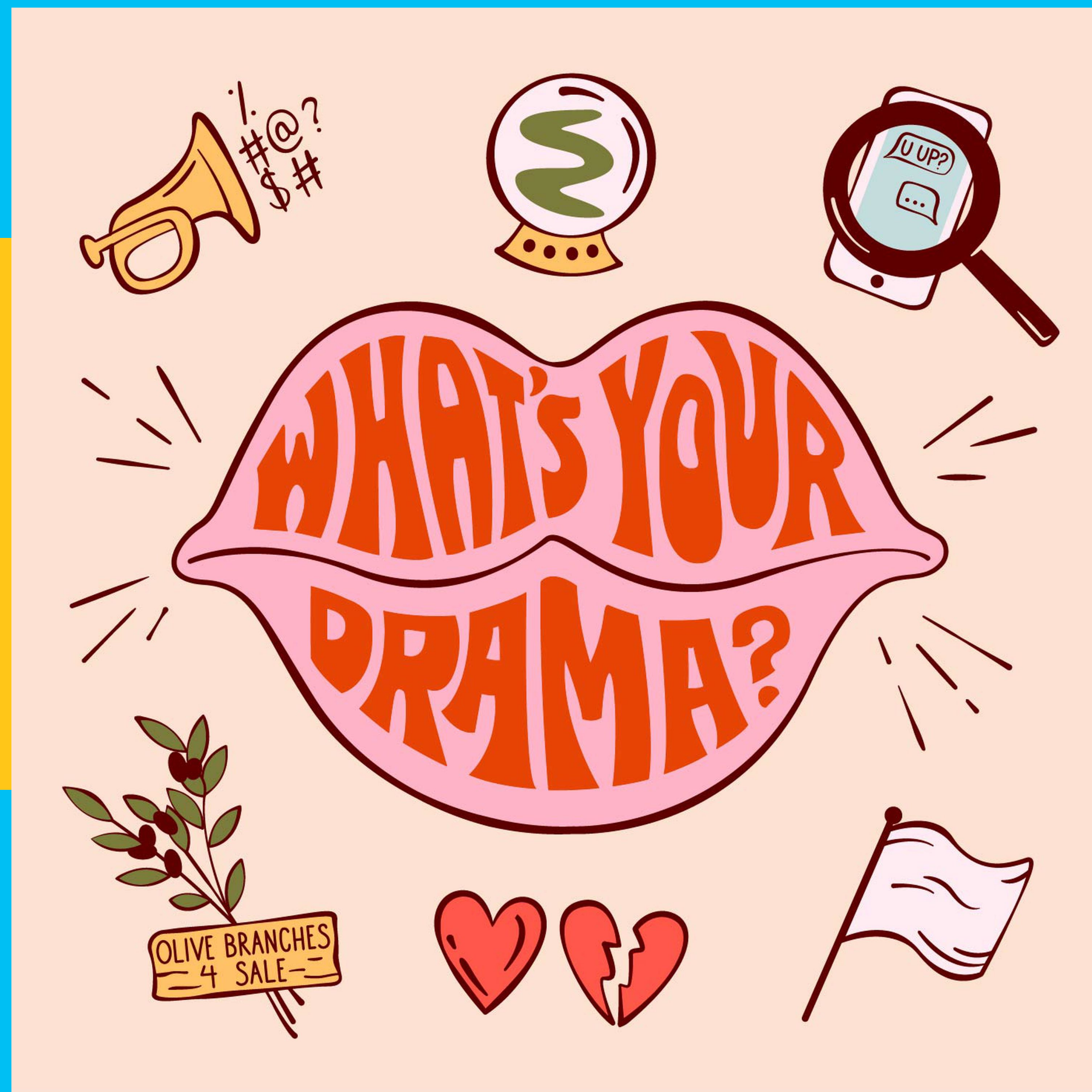
Foto verhaal met emotie