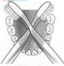
Figuur: Kruislings poetsen.