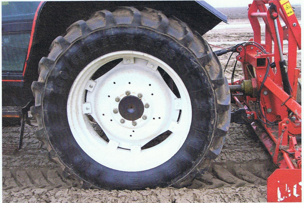
▲ Voor zo optimaal mogelijke groeiomstandigheden kun je bij een band kiezen tussen draagkracht, trekkracht, profilering en bandenspanning in relatie tot de bodemeigenschappen zoals grondsoort en bodemstructuur.

De bodemdruk wordt in sterke mate bepaald door de bandenspanning. Een vuistregel zegt dat de bodemdruk direct onder de band 1,25 maal zo hoog is als de bandenspanning (in bar). Op een diepte die gelijk is aan de bandbreedte is de bodemdruk maar de helft van de bandenspanning, en op een diepte van tweemaal de bandbreedte is bodemdruk door de band nagenoeg verdwenen. Om een juiste bandenspanning te bereiken kun je informatiebronnen van de bandenfabrikanten raadplegen. Dan kun je met name denken aan tabellen of grafieken met de load-index: hoe hoog moet de bandenspanning zijn bij bepaalde last en snelheid. LM