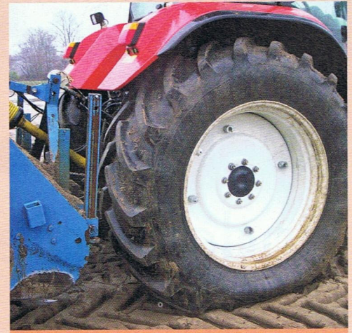
▲ Als de band op de goede spanning is gebracht, lijkt het wel of de band te zacht is. De trekkerbanden zijn evenwel gemaakt om met deze lage spanning te kunnen omgaan, waardoor het doel, overbrengen van trekkracht, goed tot zijn recht komt, zonder te veel schade in de bodem aan te richten.