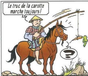
Het trucje met de wortel lukt altijd!