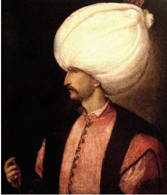
Suleiman de Grote

Van Algarije in het westen, de Krim in het noorden, Mecca in het oosten en Egypte in het zuiden. Zo groot was het Ottomaanse rijk. Enorm, maar hoe hebben deze mensen zoveel land veroverd? Zoals jullie al weten was het rijkje van Osman eerst een klein overblijfseltje van het Seljuk Turkse rijk. Al snel groeide het uit tot de machtigste van deze staatjes.