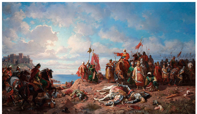
De Dood van Koning Wladislaus II van Polen, Hongarije en Croatië bij de slag om Varna.

De Europeanen waren al heel vroeg bang van ze, dat zien we aan bijvoorbeeld de kruistocht van Varna. Dit was een van de allerlaatse kruistochten. De Ottomanen versloegen de kruisvaarders met vlag en wimpel, en wisten hierna Constantinopel (Istanbul tegenwoordig) in te nemen. Constantinopel was een zeer belangrijke stad, ze was voor haar tijd enorm, en de stad was ook nog eens van zeer groot strategisch en economisch belang. Iedereen die de Zwarte zee in wilde moest langs Constantinopel en iedereen die er uit kwam ook.