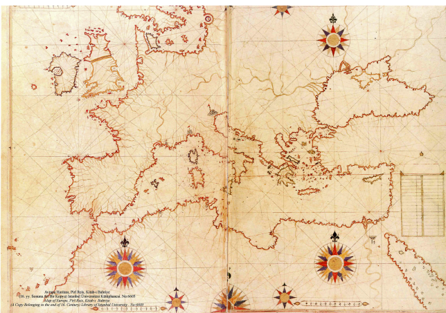
Een van de kaarten van Piri Reis

Er zijn werken bewaard gebleven over optiek, chirurgie, mechanische kennis, de ontwikkeling van astronomische klokken en enorm veel observaties over het universum. Dit kwam allemaal uit de intellectuele klasse van het Ottomaanse rijk. De Ottomanen hadden een heel groot observatiecentrum in Istanbul. Het is weergegeven hier op de afbeelding.