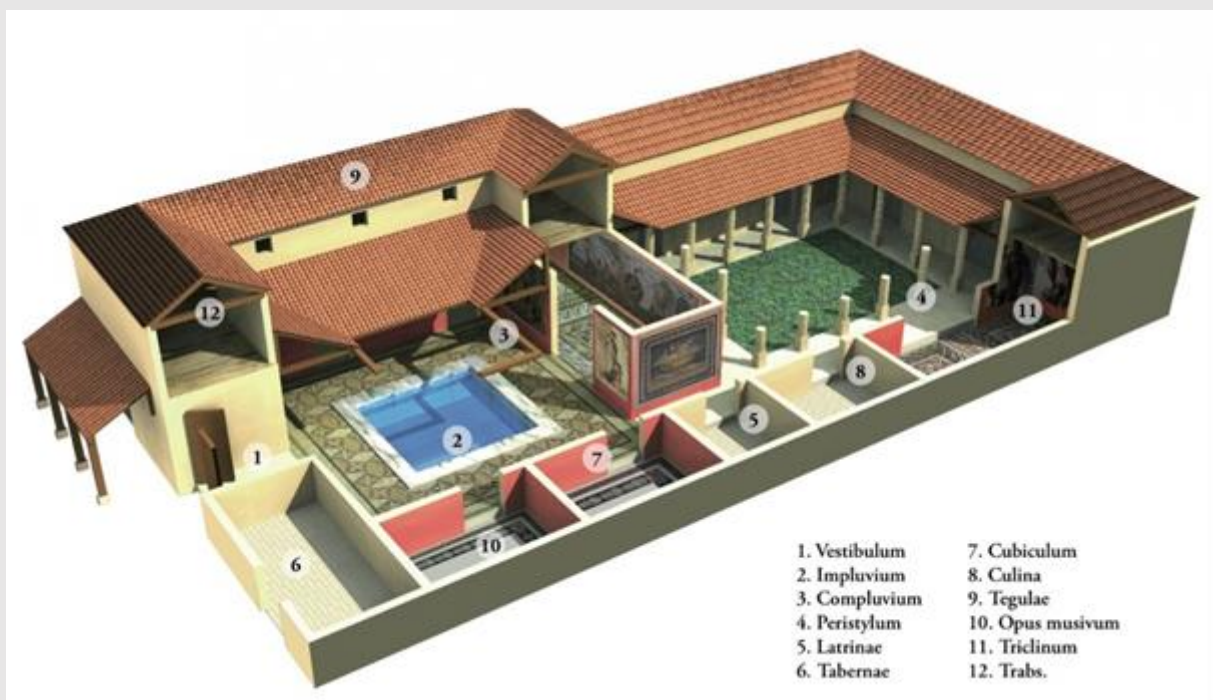
een Romeinse domus.

Zonder dat we het weten, bestaat onze taal voor een groot deel uit Latijn. Dan heb ik het niet alleen over dure woorden, zoals kwaliteit (qualitas), graviteit (gravitas), medicijnen (medicina). Misschien weet jezelf ook wel veel van dat soort woorden. Ook in onze gewone woordenschat zit het Latijn verborgen: venster (fenestra), pen (penna), dom(kerk) (domus), majoor (maior).