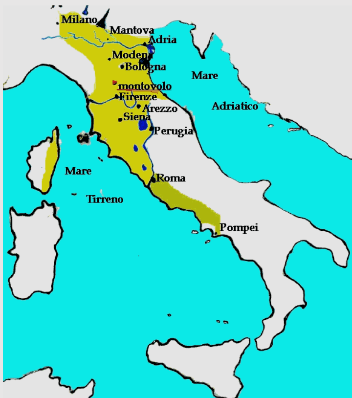
Etruria in de 6 e eeuw v.Chr.

De nieuwste ontwikkelingen in de dna-wetenschap lijken aan te tonen, dat ze uit Asia, het huidige Turkije komen. Daarop lijkt ook wel hun afwijkende gedrag: vrouwen mogen bij feesten zijn; er is sprake van een matriarchaat en hun nog niet ontcijferde taal lijkt dat ook te ondersteunen. Ook in het verhaal van Tarquinius zie je sporen van het matriarchaat.