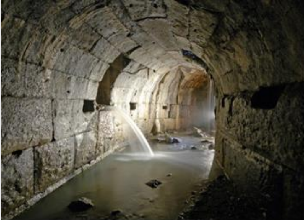
de cloaca maxima

kusten had last van malaria. de Etrusken wisten waaraan dat lag: de mug. Ze wisten ook hoe ze dat konden bestrijden: door gebieden droog te leggen. Zo hadden ze door kanalisatie hun eigen kusten gedraineerd en malariavrij gemaakt en dat hebben ze ook met het Forum van Rome gedaan. Ze hadden door rioleringen (cloacae), die er nog steeds zijn en nog steeds functioneren, het forum grotendeels drooggelegd en zo Rome malariavrij gemaakt. Die riolering liep onder de Palatijn door de Tiber in. De monding van de Cloaca Maxima is nog steeds aan de Tiber te zien.