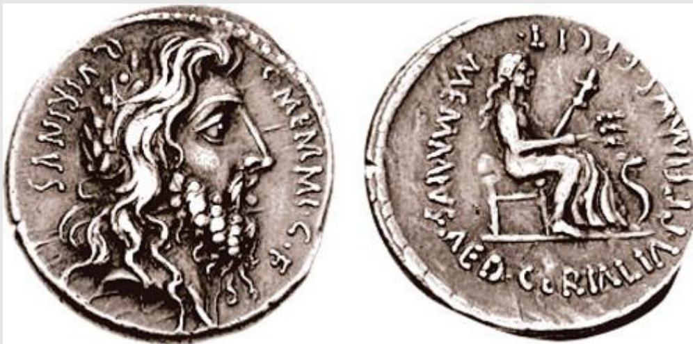
Romulus voorgesteld als Quirinus op een denarius geslagen door de aedilis C. Memmius C. f. (56 v.Chr.).