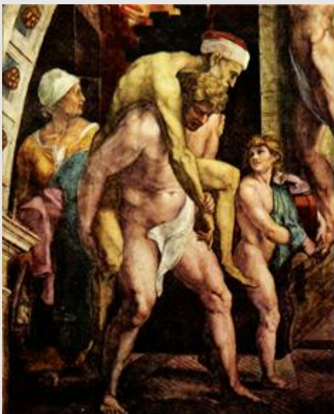
Aeneas met vader en zoon Iulus.

Hadden de Grieken Troje niet verwoest met het houten paard, dan zou Rome nooit gesticht zijn. Onder de paar overlevenden van de enorme slachtpartij bevond zich de Trojaanse prins Aeneas. Hij was de zoon van een sterfelijk mens Anchises en een godin, niemand minder dan Venus, de godin van de liefde. Aeneas had de opdracht van de goden gekregen hen in veiligheid te brengen over zee.