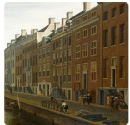
De VOC en de specerijenhandel zorgt voor grote rijkdom aan de Amsterdamse Grachtengordel