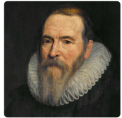
Van Oldenbarnevelt 1547 - 1619