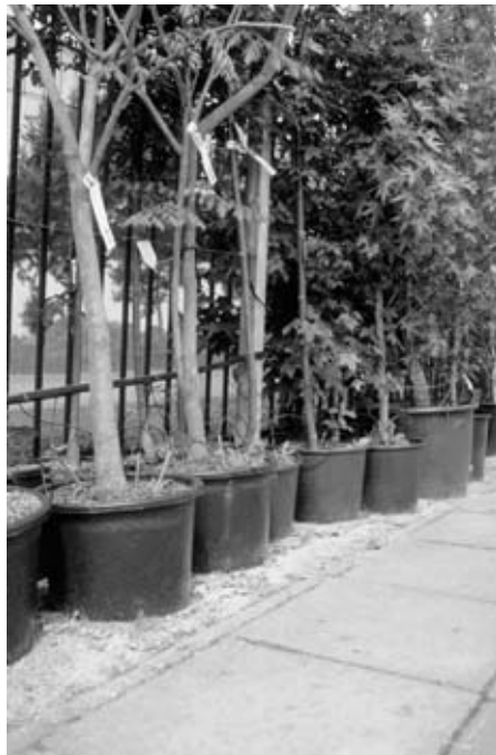
Fig. 2.1 Bomen blijven vaak langere tijd in het tuincentrum staan.

Na het maken van deze opdracht kun je de bomen op de afdeling verzorgen.