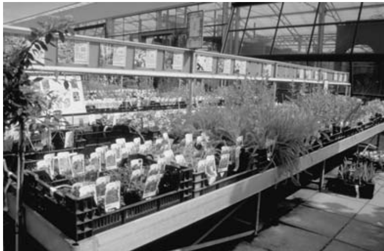
Fig. 2.4 De vaste planten vormen een aparte afdeling in het tuincentrum.

Regel bij je begeleider om een dagje mee te kunnen helpen in een tuincentrum op de afdeling van de vaste planten. Zet op papier hoe je dit denkt aan te pakken.