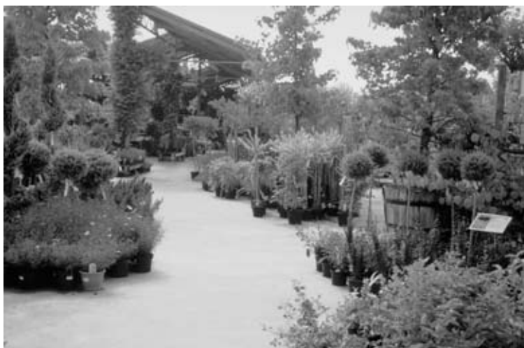
Fig. 2.2 De presentatie van heesters is een belangrijk onderdeel van de verkoop van tuinplanten.

Ga naar twee verschillende tuincentra en vergelijk ze op de volgende punten.