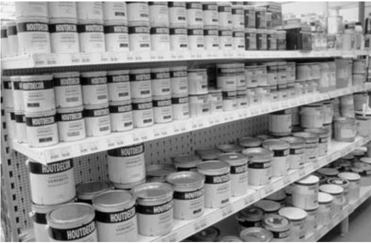
Fig. 4.2 Houtdecor.

Gezamenlijk overzicht van de hoofd- en bijzaken: