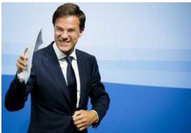
gehaald van de zwarte gemeenschap.

Premier Rutte heeft zich de woede op de hals