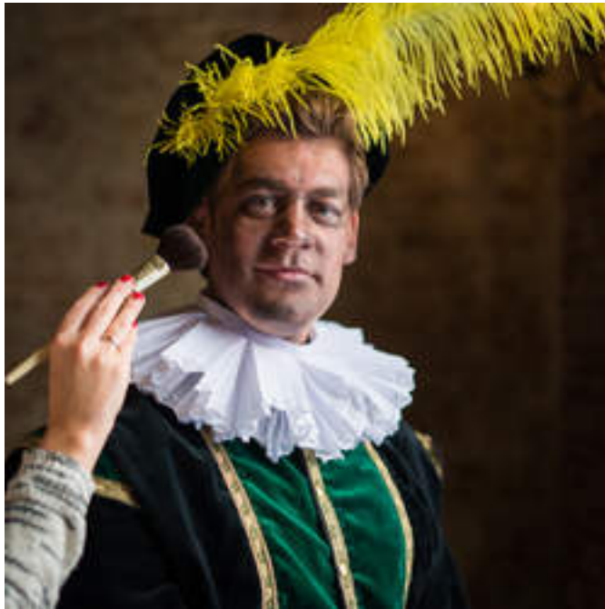
Een visagist brengt vegen aan op het gezicht van een roetpiet.

Verder onderstreept Diaconu dat zijn comité nooit op de afschaffing van tradities of symbolen zal aansturen. „Daar gaan wij niet over. Maar we hebben wel de taak om te kijken of er geen elementen in zitten die aanstootgevend zijn voor anderen."