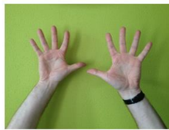
Nog 10 seconden...