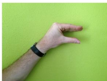
Nog een halve minuut...