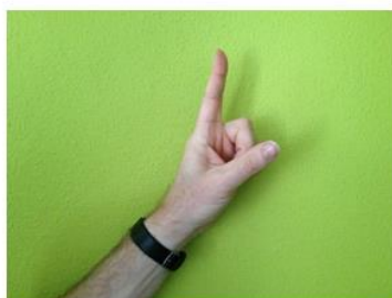
Nog één minuut...