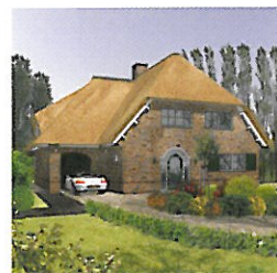
Landhuis, duur, rieten kap

De woning bestaat uit 3 lagen. De gevels zijn in metselwerk met kalkzandsteen binnen-spouw blad uitgevoerd met houten kozijnen. De woning