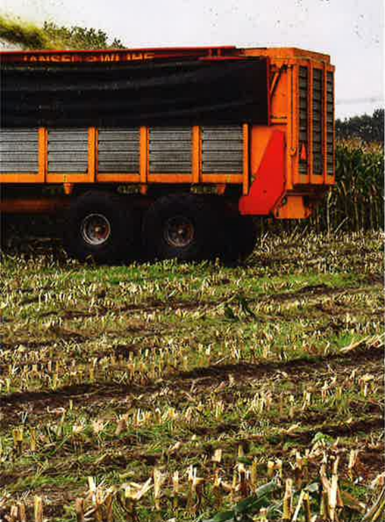
Aankoop van mais in combinatie met de rekening voor hakselen vormen grote uitgavenposten in de maand oktober.

per kilo en een voorschot op de nabetaling van €1 in september. Gemiddeld komt de melkprijs over 2016 daarmee uit op €32,38.