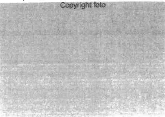
Het hoge voerhek bleek minder geschikt voor de kleine Jerseys en werd vervangen door een keerbuis.

Van der Vis kocht de dieren bewust in januari, zodat ze voor het volgende jaar nog quotum konden verleasen, mocht het allemaal tegenvallen. Maar dat blijkt niet aan de orde. Naast de eigen Jerseys lopen er op het bedrijf ook Jerseys van een veehouder ►