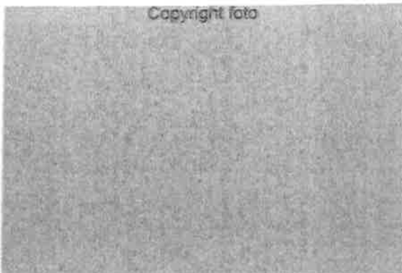
De koeien worden gemolken in een 2 x 9-stands zij-aan-zij melkstal zonder tussenhekken en krijgen daar krachtvoer verstrekt.

De koeien worden gehuisvest in een 1+4+1-rijige ligboxenstal, met langs de achterwand tevens een rij ligboxen. De stal telt in totaal 230 boxen, met daarin paardenmest als vulling. Het linkerdeel van de stal is nog ingericht voor de laatste Holsteins. Het rechterdeel is al aangepast op de Jerseys, met smallere boxen en een keerbuis in plaats van een hoog voerhek. Geheel rechts het Jersey-jongvee.