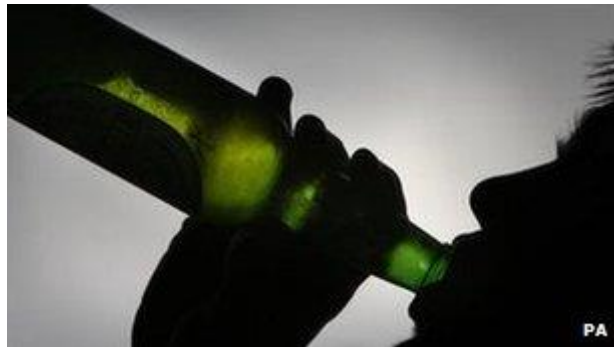
Young people were more likely to get alcohol from relatives than from a shop, Demos said

2 It says offenders should do community service or be banned from shops. Over a four-year period, just 16 people were convicted in the UK of buying alcohol for a child, it added.