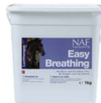
NAF Easy Breathing