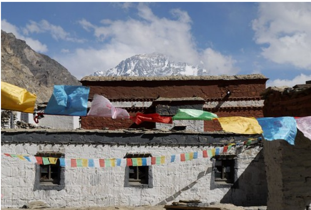
Mount Everest gezien vanuit het Rongphu-klooster

Bepaalde natuurgebieden geven ook uitdrukking aan de identiteit van een groep of nationaliteit. Denk hierbij bijvoorbeeld aan de Everglades en de Grand Canyon in Amerika, het nationaal park Serengeti in Tanzania en het nationaal park Sagarmatha (Mount Everest) in Nepal en Los Glaciares in Argentinië.