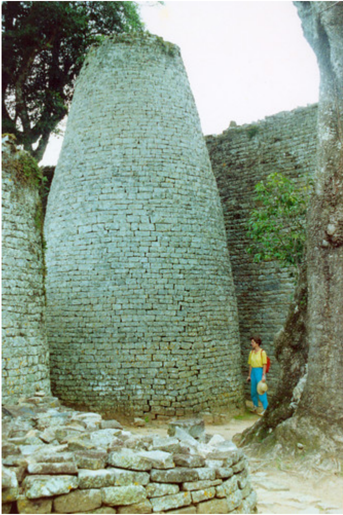
Nationaal Monument Groot-Zimbabwe