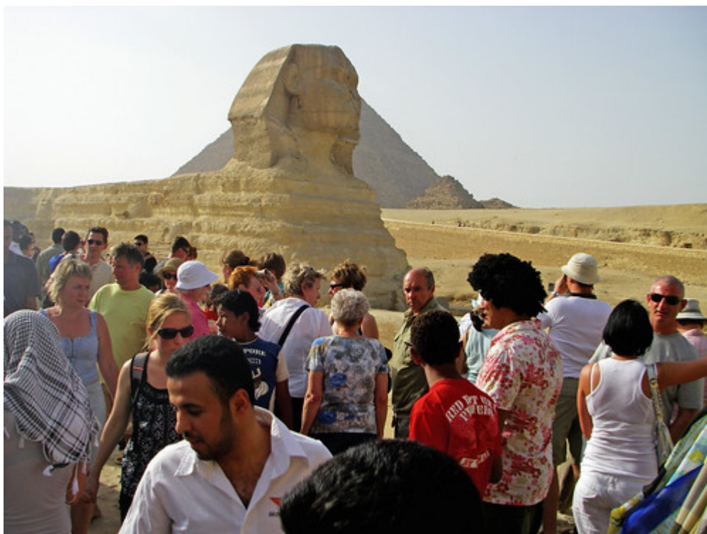
Toerisme in Egypte

Er is een nieuw soort toerisme nodig, dat ecologische en duurzame ontwikkeling ondersteunt en gastlanden aanmoedigt om hun culturele identiteit opnieuw te bevestigen en hun cultuur en omgeving beter bekend, geliefd en gewaardeerd te maken door bezoekers. Tegelijkertijd bestaat de behoefte aan een echte interculturele dialoog, wederzijds respect en solidariteit. In landen met watertekort, kunnen toeristen bijvoorbeeld hun solidariteit tonen door water te besparen en hun handdoeken en lakens niet dagelijks te laten wassen.