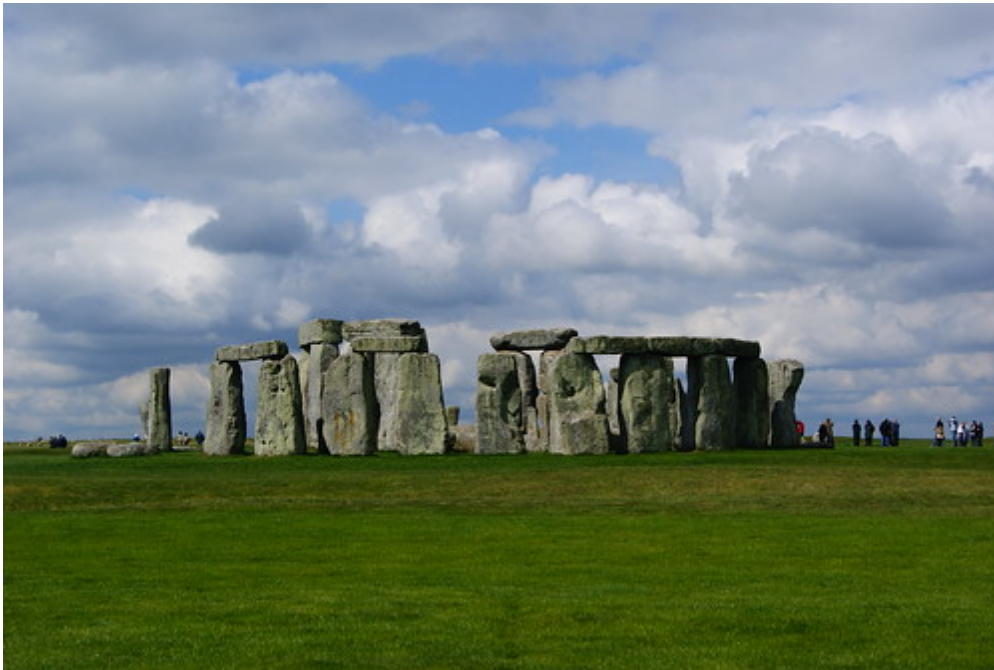
Stonehenge, Groot-Brittannië