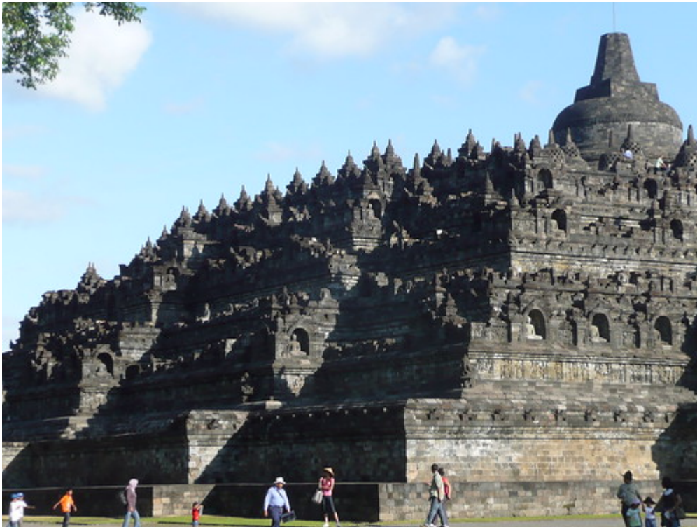
Borobudur, Indonesië

Voor veel andere Werelderfgoederen vormt autoverkeer een groot gevaar. De weg in de buurt van Stonehenge in Groot-Brittannië, bedreigt het ongeschonden karakter van dit erfgoed. Het voorstel om in Egypte een snelweg aan te leggen van Giza naar Dashur, in de buurt van de piramides, werd op verzoek van UNESCO tegengehouden door de Egyptische autoriteiten.