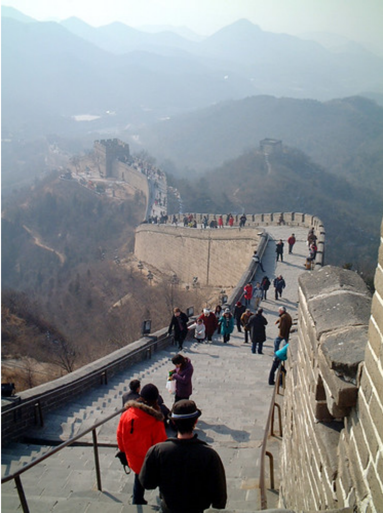
De Chinese Muur (Flickr/d.FUKA)

Een grote uitdaging voor Werelderfgoedbehoud is om bezoekers toe te laten zonder dat het schadelijke effecten heeft. Erfgoederen die altijd mooi en goed onderhouden zijn gebleven vanwege hun ontoegankelijkheid, zijn nu gemakkelijk te bereiken via reisbureaus en touroperators. Daarom heeft ieder Werelderfgoed een passend toerismebeleid nodig.