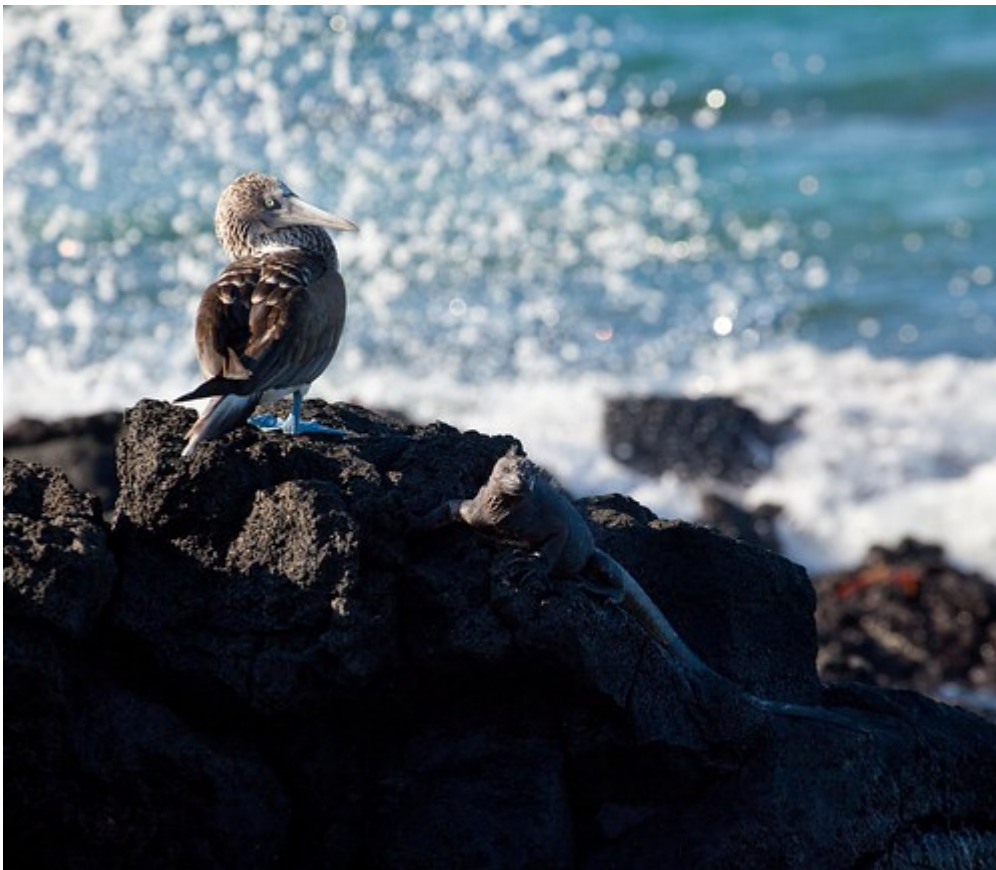
De Galapagos eilanden, een kwetsbaar natuurgebied

Massatoerisme kan ernstige gevolgen hebben voor het behoud van culturele erfgoederen (beschadiging door het hoge aantal bezoekers) en natuurlijke erfgoederen (bijvoorbeeld het introduceren van vreemde plant- of diersoorten door toeristen, het bouwen van toeristenverblijven langs kwetsbare kustlijnen, vervuiling door toerisme). Elk erfgoed, en met name Werelderfgoederen, moet op een fatsoenlijke manier beheerd worden. Het is belangrijk dat jonge mensen nadenken over hun eventuele bijdragen aan het beheer van een erfgoed. Zij zijn immers de toekomstige beleidsvormers.