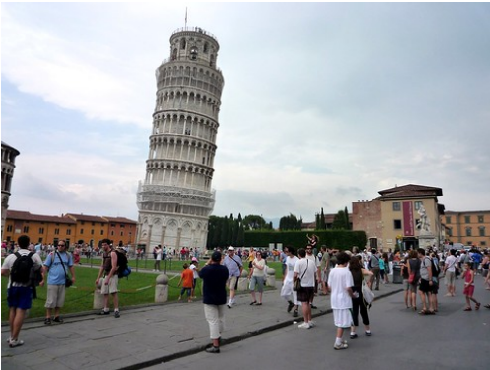
De toren van Pisa, Italië

Koïchiro Matsuura, Directeur-Generaal van UNESCO, op het UNEP Global Ministerial Environment Forum, Nairobi, 8 februari 2001