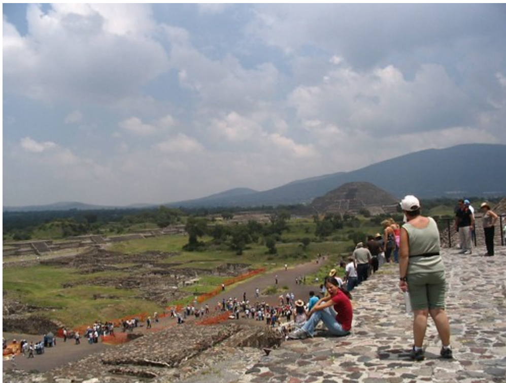
De historische stad Teotihuacan, Mexico

Omdat er steeds meer mensen in grote steden wonen, stijgt de belangstelling voor natuurschoon en natuurlijke Werelderfgoederen. Dit soort toerisme wordt ook wel ecotoerisme genoemd. Reizen naar culturele locaties noemt men cultureel toerisme.