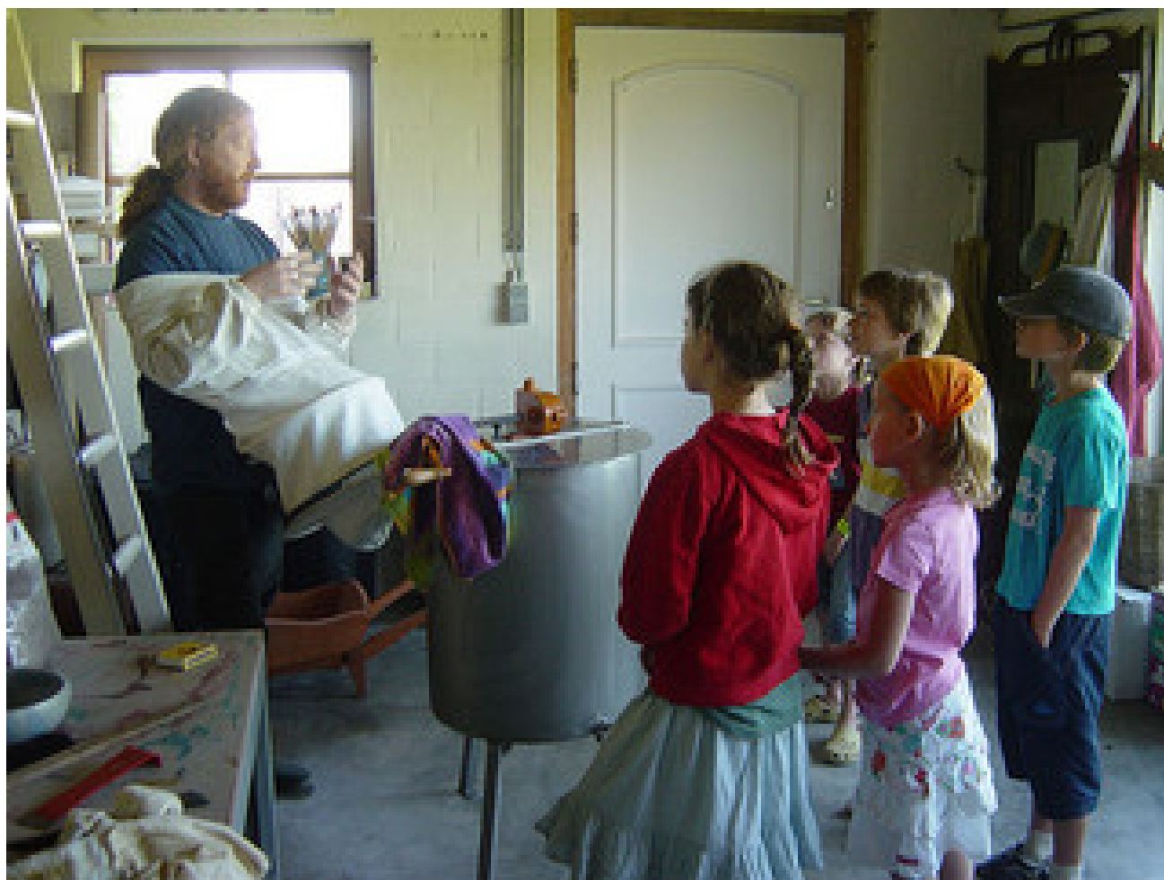
Bezoek een imker.

Ga met de klas naar een imker en leer alles over bijen.