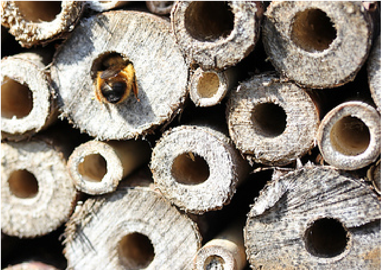
Bij in bijenhotel.

https://www.schooltv.nl/beeldbank/embedded.jsp?clip=20070809_wildebijen01