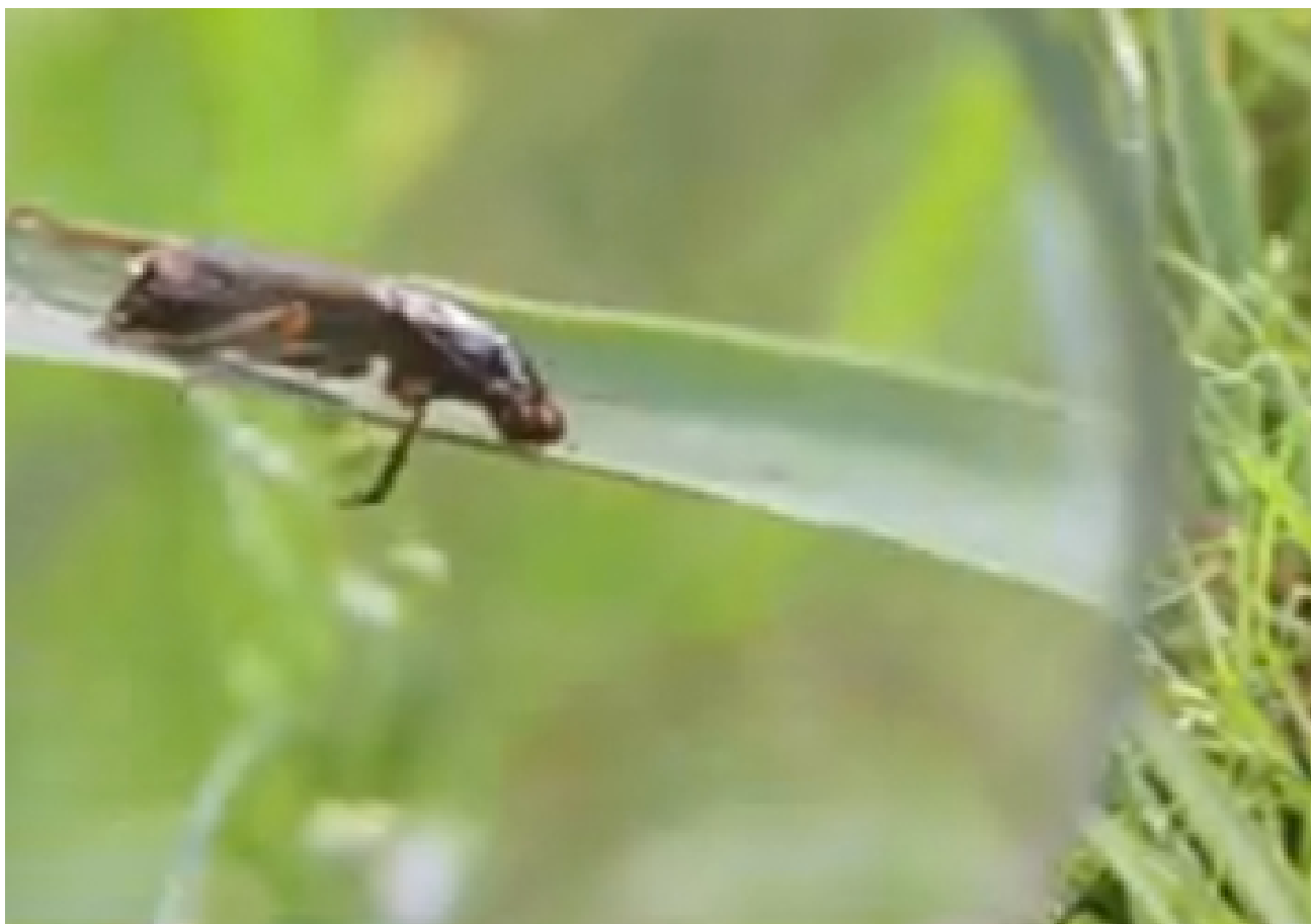
Kikkerdril, de film