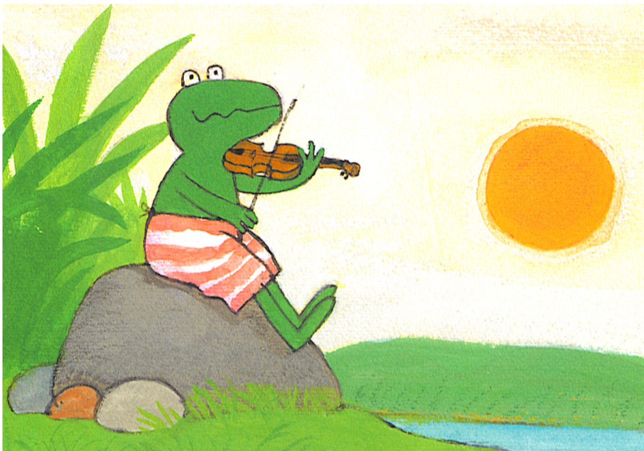
Kikker is kikker