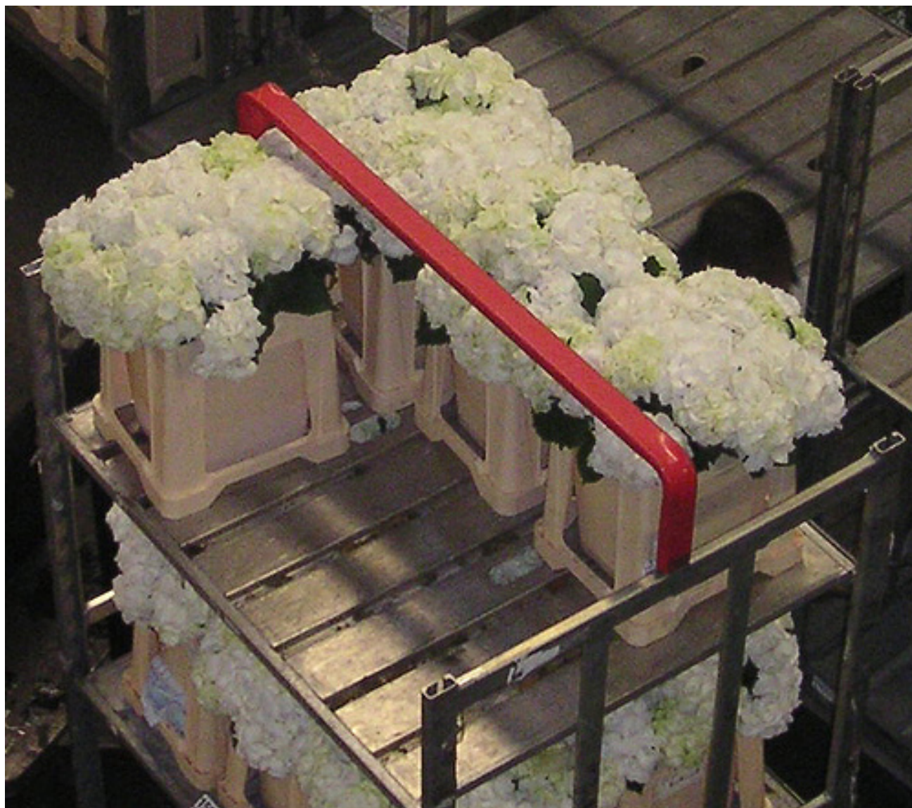
Het product klaar voor verkoop

Geef aan waar je op moet letten bij het verkoop klaar maken.