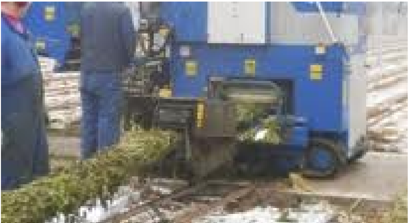
Afbeelding gewas ruimen tomaat

http://provisioning.ontwikkelcentrum.nl/objects/OC-37049d/index.html