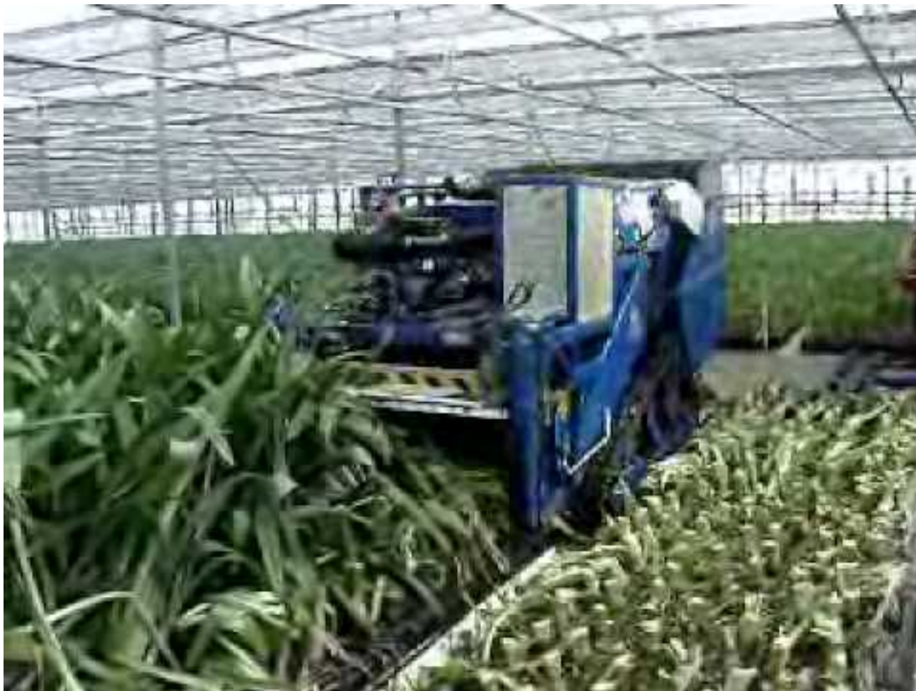
Amaryllis gewas met versnipperaar