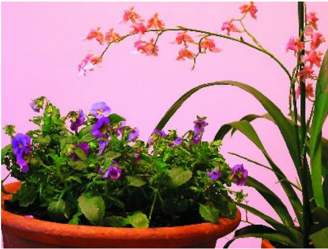
Figuur 1-25: Een tropische plant heeft een hogere optimale temperatuur dan een plant uit een koel klimaat.