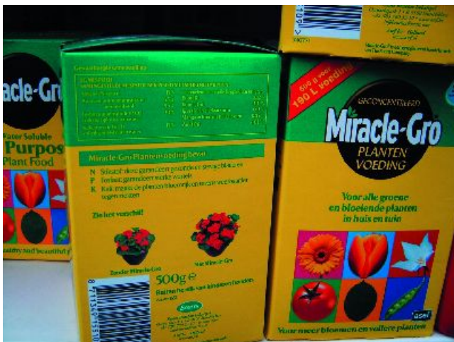
Figuur 1-23: Een samengestelde meststof bevat hoofdelementen en spoorelementen.