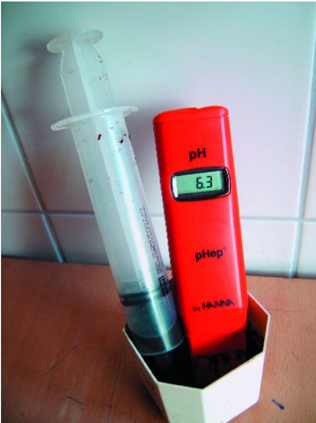
Figuur 1-24: Met een pH-meter kun je de zuurgraad van het water in de grond meten.