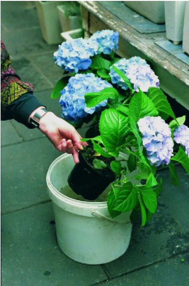
Figuur 1-22: Heesterachtige soorten zoals hortensia dompel je om alle fijne wortels van water te voorzien.