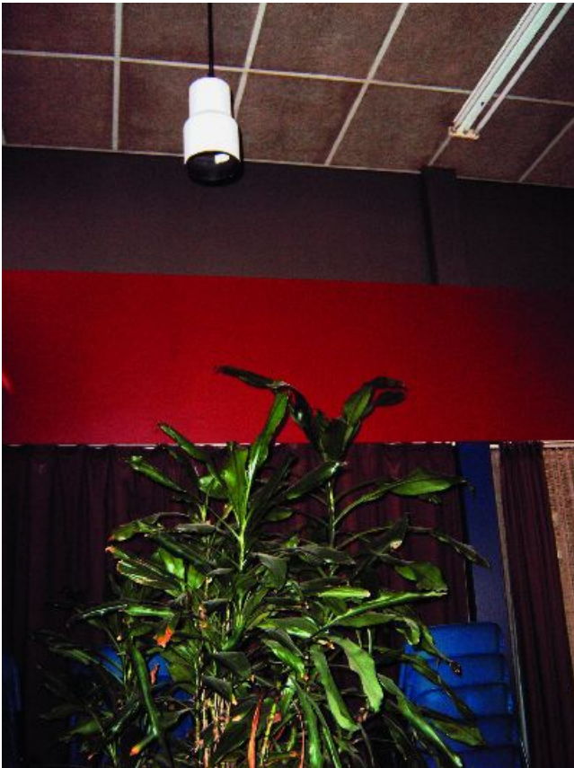
Figuur 1-21: Met speciale lampen kun je op donkere plaatsen toch planten laten groeien.