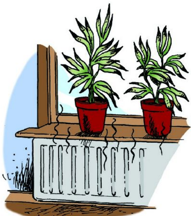
Figuur 1-26: Opgewarmde lucht is droog en heeft een lage RV.

Bij een hoge RV verdampt een plant minder water dan bij een lage RV. Als de de RV te laag is, zullen veel planten slap gaan hangen. De RV kun je meten met een hygrometer .