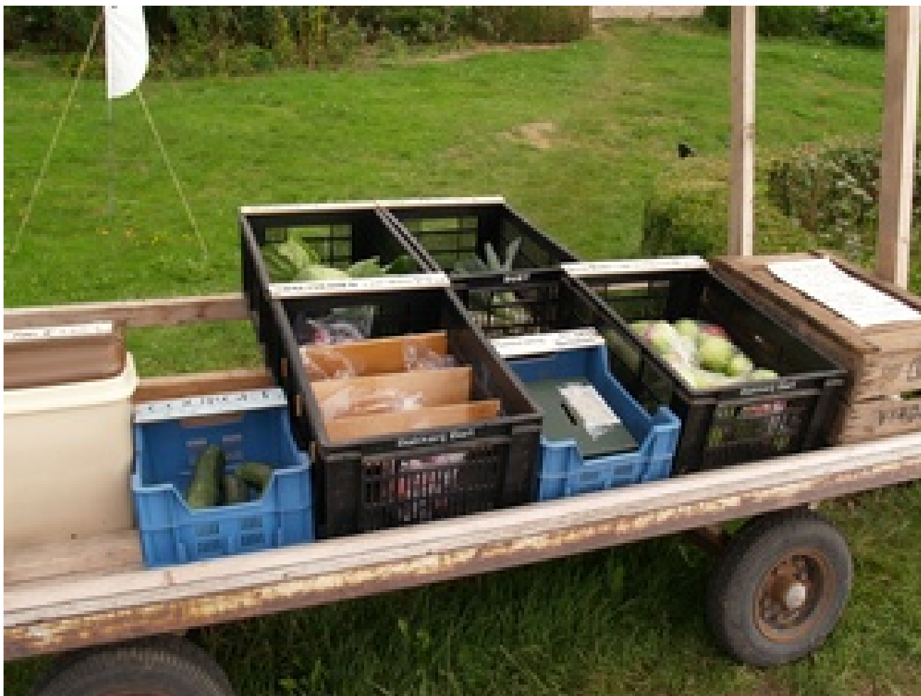
eenvoudigste vorm van verkoop bij huis