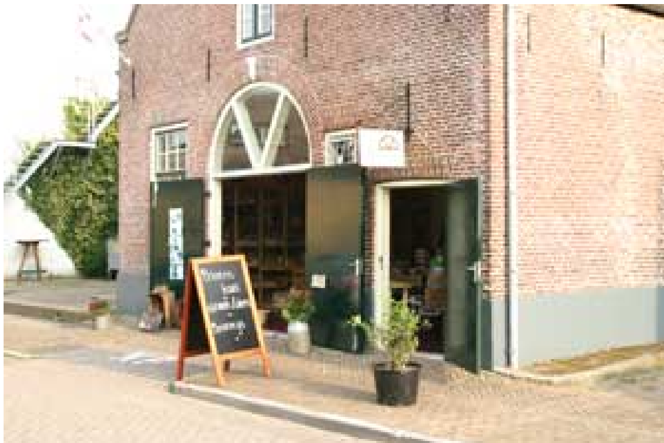
De Baander in Hardenberg