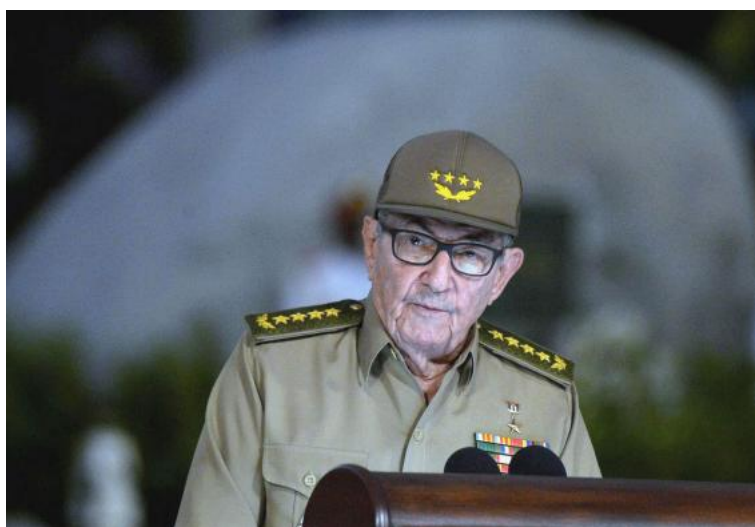
Raúl Castro bij de viering van het jubileum van de Cubaanse revolutie

september 2019 - De voorzitter van de Cubaanse Communistische Partij Raúl Castro mag het grondgebied van de Verenigde Staten niet meer betreden. Dat heeft de Amerikaanse minister van Buitenlandse Zaken bekendgemaakt. Castro is de broer van Fidel Castro, degene die de republiek Cuba omvormde tot een communistische staat. Raúl Castro oefent veel invloed uit op politieke en militaire beslissingen van Cuba. Volgens de minister heeft Castro mensenrechten geschonden door het regime van de Venezolaanse president Nicolás Maduro te steunen. Ook de directe familieleden van Castro kunnen de Verenigde Staten niet meer betreden of hebben grote kans uitgeleverd te worden aan de Verenigde Staten als ze een gebied betreden waar de Verenigde Staten veel invloed op heeft. Volgens de Verenigde Staten is Castro indirect verantwoordelijk voor het geweld, intimidatie en de onderdrukking door het regime-Maduro. Met de sanctie willen de Verenigde Staten vooral dat Cuba stopt met het steunen van Maduro. In de zomer van 2019 besloten de Verenigde Staten al het zeecruisetoerisme naar Cuba te stoppen.