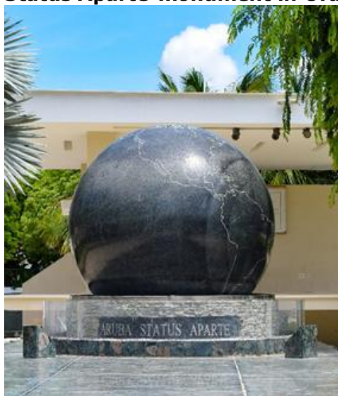
Bron 2 Status Aparte-monument in Oranjestad, Aruba

In 1942 kondigde Koningin Wilhelmina via Radio Oranje aan dat de overzeese gebieden meer zelfstandigheid zouden krijgen. In 1945 riep Nederlands-Indië als eerste overzees gebied van Nederland de onafhankelijkheid uit. In 1948 kwamen onderhandelingen voor zelfstandigheid tussen de 'Nederlandse Antillen' (de nieuwe naam voor de zes eilanden) en Suriname. In 1954 werd het 'Statuut voor het Koninkrijk der Nederlanden' gepubliceerd. Hierin werd afgesproken dat de inwoners van de Nederlandse Antillen voortaan zelf hun land mochten gaan besturen en kiesrecht kregen. Het uitgangspunt van het statuut was de gelijkwaardigheid van Nederland,