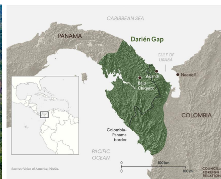
Bron 1. Darién Gap

De definitie van de grens tussen Noord- en Zuid-Amerika is dus voornamelijk gebaseerd op topografische en ecologische liggingsskenmerken die vallen binnen de dimensie 'natuur en milieu'.