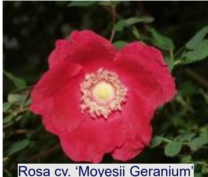
Rosa cv. 'Moyesii Geranium'