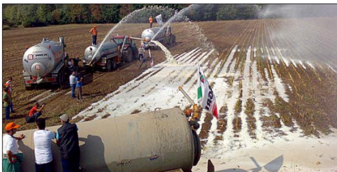
Figuur 2 Europese boeren rijden hun melkoverschot uit tijdens een protest tegen het verlagen van subsidies

Welk verband is er tussen de twee bovenstaande foto's?