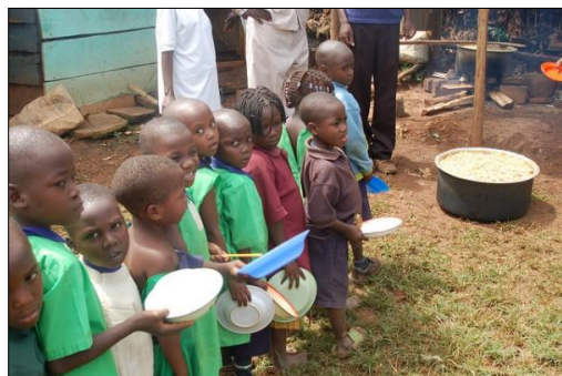
Figuur 1 Kinderen in de rij voor voedseluitgifte