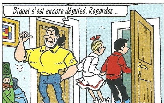
Bik heeft zich weer verkleed. Kijk maar...