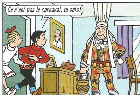
Het is geen carnaval, hoor!