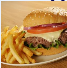
Foto: Broodje hamburger

Een man gaf de eigenaar van een Canadees restaurant een enorme fooi nadat hij een hamburger en friet had gegeten.