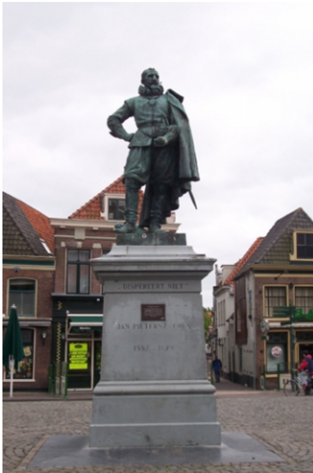
Een standbeeld van Jan Pieterszoon Coen

Overblijfselen van de VOC zien we in Nederland nog overal. Je hebt eerder al een debat gevoerd over de ethische kwesties rondom de VOC. Bij deze opdracht ga je daar nog wat verder op in. Er zijn nog steeds VOC monumenten in Nederland. Inmiddels zijn er stemmen die zeggen dat deze verwijderd moeten worden of dat ze op een bepaalde manier veranderd moeten worden. Wat is jouw mening hier over?