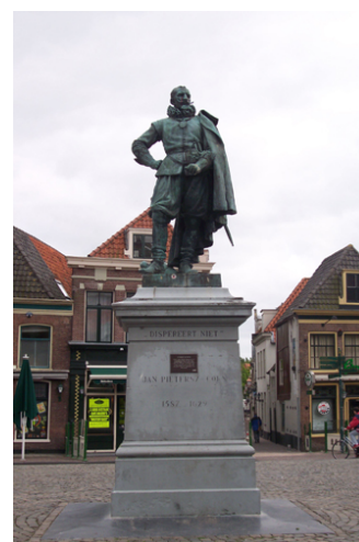
Een standbeeld van Jan Pieterszoon Coen

Overblijfselen van de VOC zien we in Nederland nog overal. Je hebt eerder al een debat gevoerd over de ethische kwesties rondom de VOC. Bij deze opdracht ga je daar nog wat verder op in. Er zijn nog steeds VOC monumenten in Nederland. Inmiddels zijn er stemmen die zeggen dat deze verwijderd moeten worden of dat ze op een bepaalde manier veranderd moeten worden. Wat is jouw mening hier over?