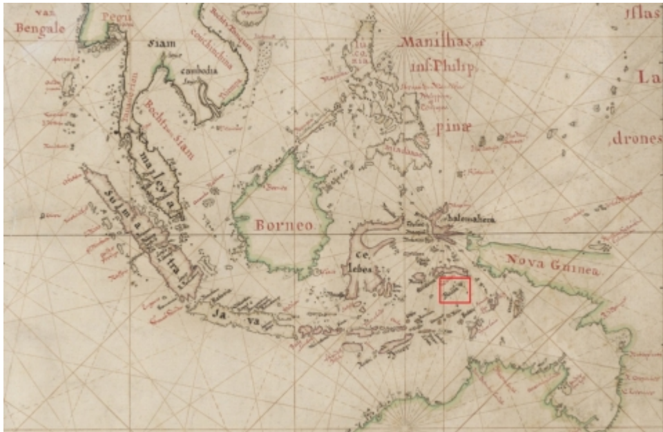
Een deel van het Octrooigebied van de VOC circa 1660

De VOC was een enorm bedrijf, het rijkste ter wereld ooit zelfs. Tussen 1700 en 1795 had de VOC 655.000 werknemers. Zelfs nu zou dat een enorm groot bedrijf zijn. Kijk maar eens naar deze lijst uit 2015 met de grootste werkgevers ter wereld .