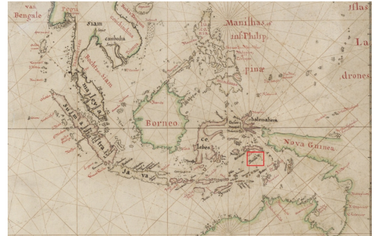
Een deel van het Octrooigebied van de VOC circa 1660

De VOC was een enorm bedrijf, het rijkste ter wereld ooit zelfs. Tussen 1700 en 1795 had de VOC 655.000 werknemers. Zelfs nu zou dat een enorm groot bedrijf zijn. Kijk maar eens naar deze lijst uit 2015 met de grootste werkgevers ter wereld .