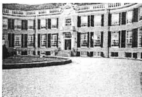
- het eindresultaat -

Het grind wordt vervolgens eenvoudig in de honingraten verwerkt. Een laag grind van 10 - 20 mm boven op de platen zorgt ervoor dat ze onzichtbaar blijven.