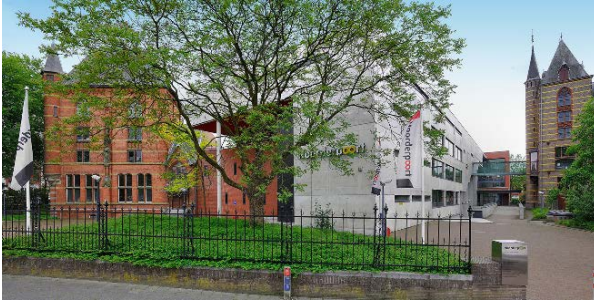
Verlengde Visserstraat 20

Gymnastiek en mogelijk Engels; Rekenen; Burgerschap